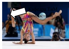
Смоленский государственный университет спорта