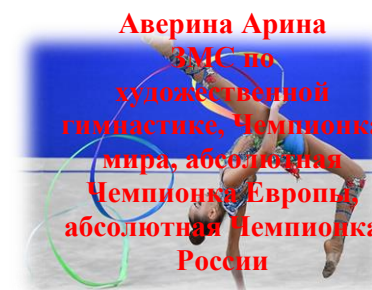
Аверина Арина ЗМС по художественной гимнастике, Чемпионка мира, абсолютная Чемпионка Европы, абсолютная Чемпионка России