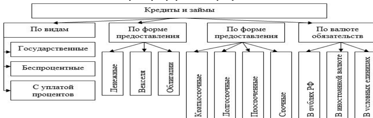
Рисунок 1.3 - Классификация кредитов и займов в соответствии с законодательными актами по бухгалтерскому учету